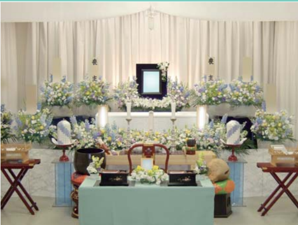
花祭壇に変更できます ご供花2基はセット含みます