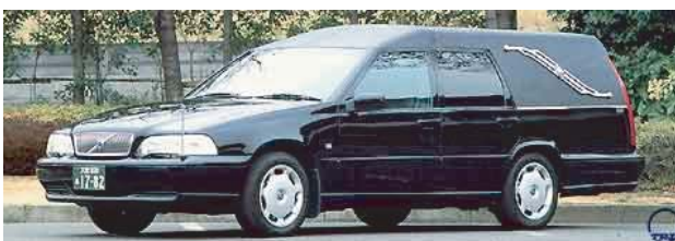
出棺の車両変更ご希望の場合はお申し付け下さい