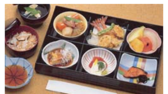
セット鈴蘭@20 より上記 写真あけび等に変更できます (単価 3,570円)