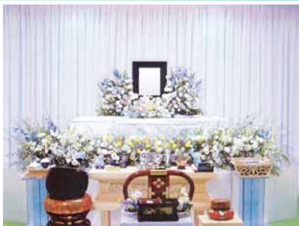
花祭壇に変更できます ご供花 2 基はセット含みます