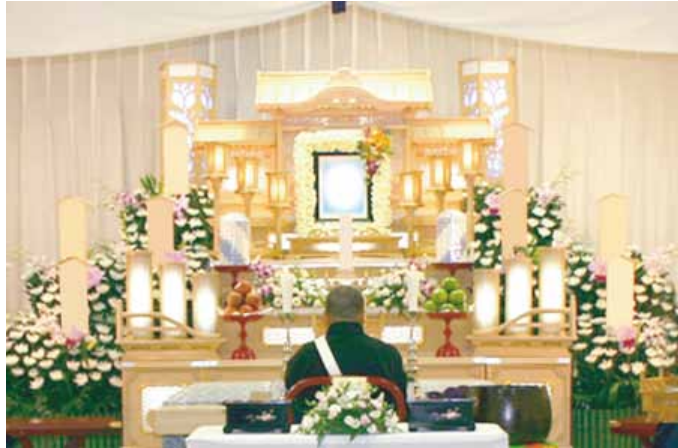
白木五段祭壇 祭壇脇生花 2 基を含む