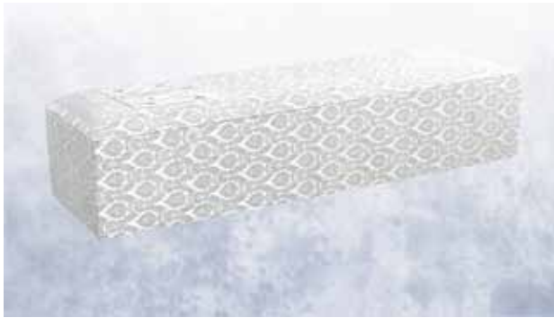
白布張り高級棺 (6 尺) (6.25 尺へ変更は +3,150 円)

菩提寺が無い又は遠方で来られない等の場合は担当者へお申し付け下さいご紹介いたします。(1日5万円よりご紹介できます。)