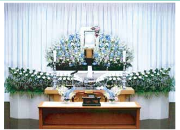
その他飾り付けの変更承ります。