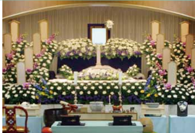
花祭壇は花材や色などご自由に指定出来ます