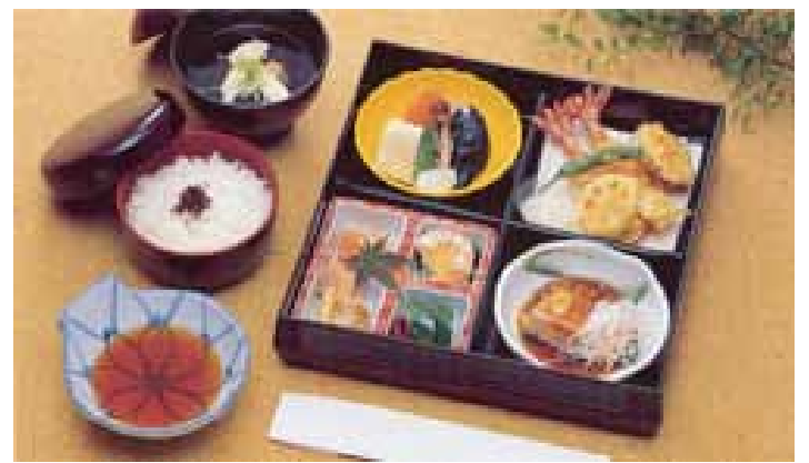
精進落とし会席ご膳 鈴蘭@20