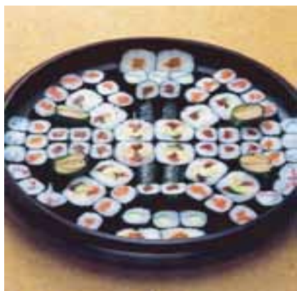
巻寿司 3 人盛@12

菩提寺が無い又は遠方で来られない等の場合は担当者へお申し付け下さいご紹介いたします。(1日5万円よりご紹介できます。)