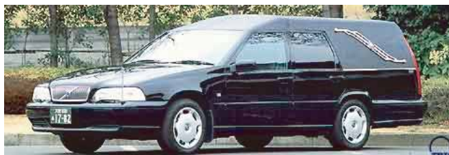
出棺の車両をご希望の場合は お申し付け下さい