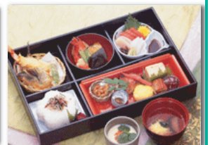
セット+21,000円にて セット「天城」@20より上記 写真「白根」に変更できます