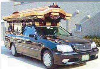
出棺の車両変更ご希望の 場合はお申し付け下さい