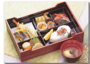
精進落とし会席ご膳 天城@20 瑞江葬儀所出棺の場合は 火葬中でのご会食となります。