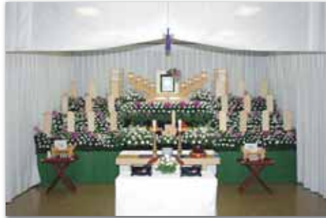
セット+9万円にて上記 花祭壇に変更できます 写真祭壇脇ご供花は一對 (2基)セットに含みます