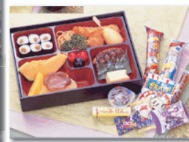
お子様膳(お菓子付き) 2,625円