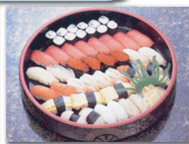
セット+25,725円にて 巻寿司を上握寿司 7台へ変更できます