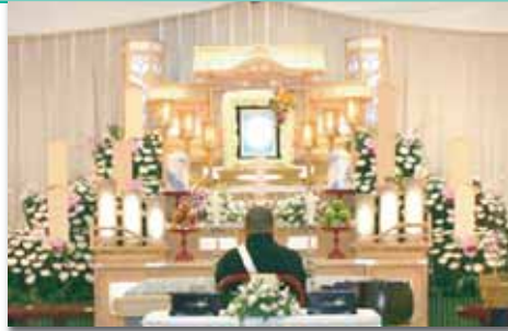
白木五段祭壇 祭壇脇生花2基を含む