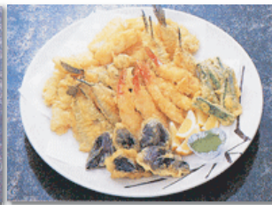
天婦羅盛り合わせ@7