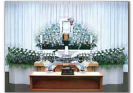
セット+18万円にて上記 花祭壇に変更できます ご供花2基はセット含みます