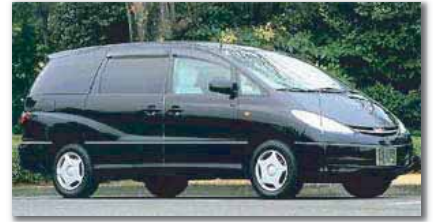
火葬場への霊柩車 (クラウンワゴン型になる場合が ございます。ご了承下さい)