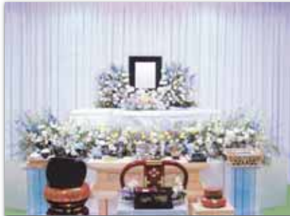
セット+7万円にて上記 花祭壇に変更できます ご供花2基はセット含みます