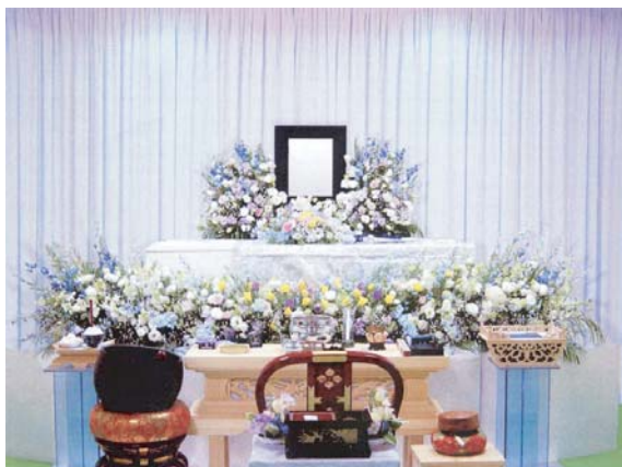
セット+7万円にて上記 花祭壇に変更できます ご供花2基はセット含みます