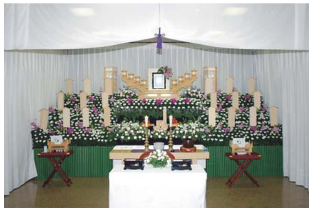
セット+9万円にて上記 花祭壇に変更できます 写真祭壇脇ご供花は一對 (2基)セットに含みます