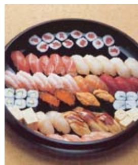
セット+67,200円 にて巻寿司を上握 寿司変更できます