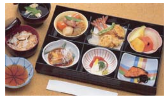
セット+22,000円にて セット鈴蘭@20より上記 写真あげびに変更できます