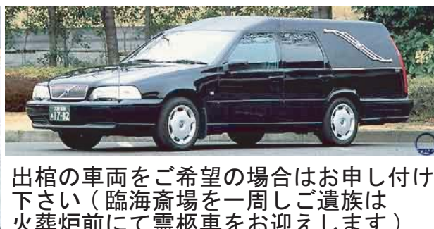
出棺の車両をご希望の場合はお申し付け 下さい(臨海斎場を一周しご遺族は 火葬炉前にて霊柩車をお迎えします)