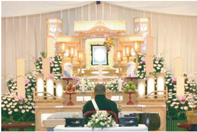
白木五段祭壇 祭壇脇生花2基を含む