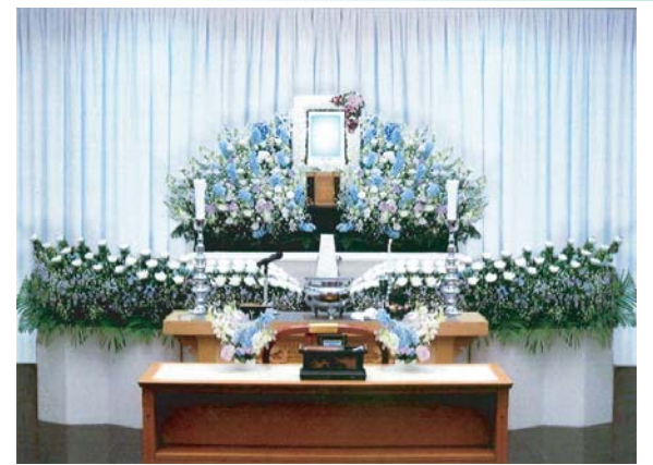
セット+18万円にて上記 花祭壇に変更できます ご供花2基はセット含みます