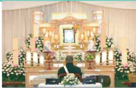
白木五段祭壇 祭壇脇生花 2 基を含む