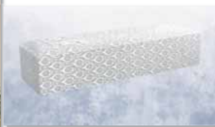
白布張り高級棺 (6 尺) (6.25 尺へ変更は +3,000 円)