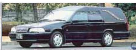
出棺の車両変更ご希望の場合はお申し 付け下さい