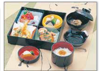
精進落とし会席ご膳 もくれん 4,300 円@20