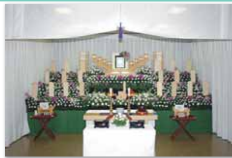
セット+9万円にて上記 花祭壇に変更できます 写真祭壇脇ご供花は一对 (2 基) セットに含みます