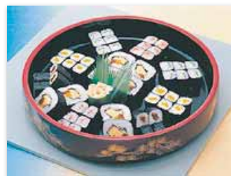
巻寿司 5 人盛@7