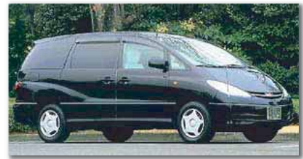
火葬場への霊柩車 (クラウンワゴン型になる場合が ございます。ご了承下さい)