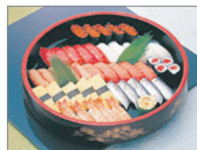
セット+29,400 円に て巻寿司を江戸前寿司 7 台へ変更できます