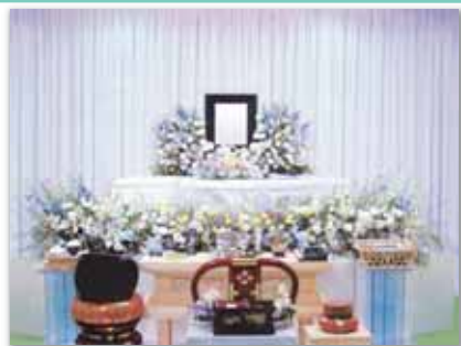
セット+7万円にて上記 花祭壇に変更できます ご供花 2 基はセット含みます