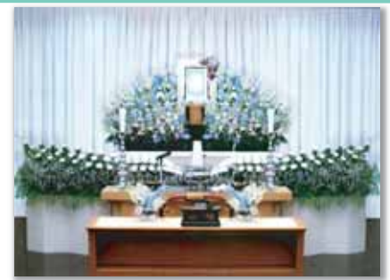
セット+18万円にて上記 花祭壇に変更できます ご供花 2 基はセット含みます