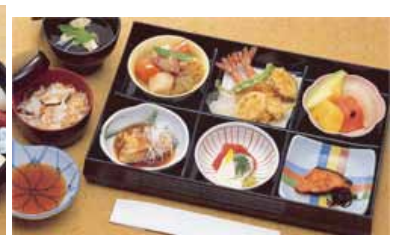
鈴蘭@20 より上記写真 あけびに変更できます (単価 3,570 円)