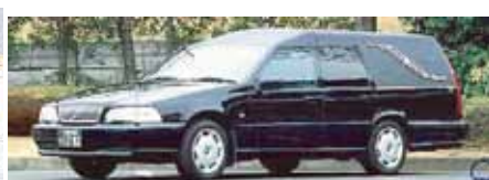
出棺の車両をご希望の場合は お申し付け下さい