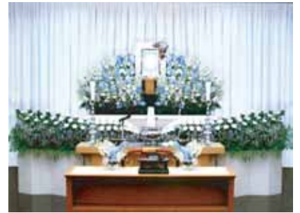
その他飾り付けの変更承ります。