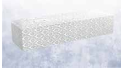
白布張り高級棺 (6 尺) (6.25 尺へ変更は +3,000 円)