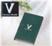
返礼品 (祖供養品) ハンドタオル@100 付き