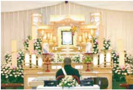
白木五段祭壇 祭壇脇生花 2 基を含む