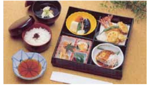
精進落し会席ご膳【鈴蘭】@20 (単価 2,415 円)