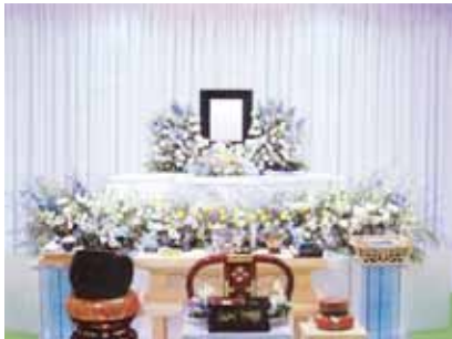
花祭壇に変更できます ご供花 2 基はセット含みます