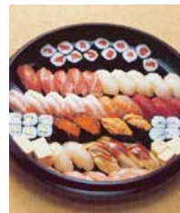
巻寿司を上握寿司 変更できます