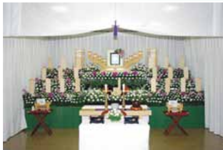
花祭壇は花材や色などご自由に 指定出来ます