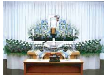
その他飾り付けの変更承ります。