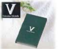
返礼品(祖供養品) ハンドタオル@50 付き