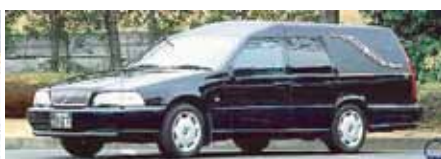
出棺の車両をご希望の場合は お申し付け下さい