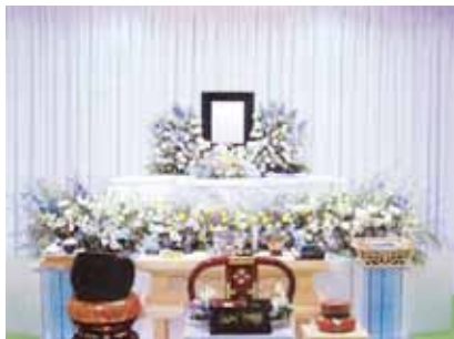
花祭壇に変更できます ご供花2基はセット含みます