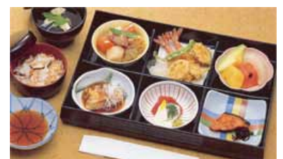
セット鈴蘭@20より上記 写真あけびに変更できます (単価3,570円)