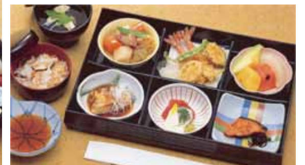
セット鈴蘭@20より上記 写真あけびに変更できます (単価3,570円)