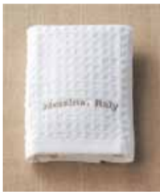
返礼品 (祖供養品) ハンドタオル@200 付き (525円 品種変更可)

配膳人通夜 1人 告別式 1人 御飲物 70,000円分を含む ※70,000円を超えた場合は超過分のご請求となります。