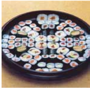
巻寿司 3 人盛@24

菩提寺が無い又は遠方で来られない等の場合は担当者へお申し付け下さいご紹介いたします。(1日5万円よりご紹介できます。)