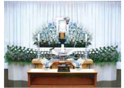
その他飾り付けの変更承ります。