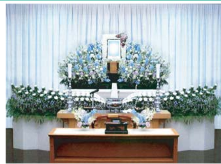
セット+189,000円にて上記花祭壇に変更できます ご供花2基はセット含みます