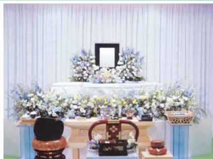
セット+84,000円にて上記花祭壇に変更できます ご供花2基はセット含みます