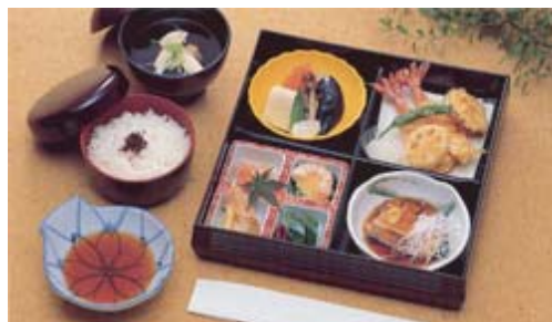
精進落とし会席ご膳【鈴蘭】@20