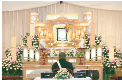
白木五段祭壇 祭壇脇生花2基を含む