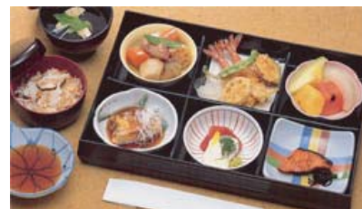
セット+23,100円にてセット鈴蘭@20より上記写真あけびに変更できます