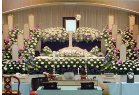
セット+126,000円にて上記花祭壇に変更できます 写真祭壇脇ご供花は一对(2基)セットに含みます