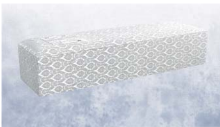
白布張り高級棺 (6尺) (6.25尺へ変更は +3,150円)

菩提寺が無い又は遠方で来られない等の場合は担当者へお申し付け下さいご紹介いたします。(1日5万円よりご紹介できます。)