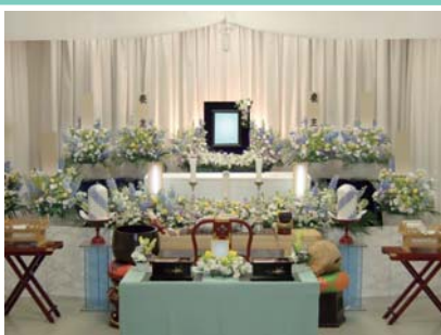
セット +73,500円にて上記 花祭壇に変更できます