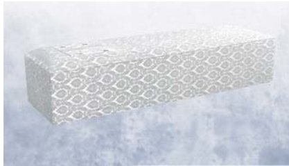
白布張り高級棺 (6尺) (6.25尺へ変更は +3,150円)