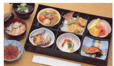
セット +23,100円にて セット鈴蘭@20より上記 写真あけびに変更できます