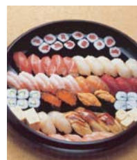
セット +45,360円にて 巻寿司を上握寿司 18台へ変更できます