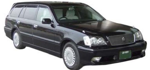
瑞江葬儀所への霊柩車とマイクロバス 24人乗り (エステイマ型になる場合がございます。ご了承下さい)