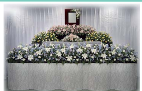
セット +189,000円にて上記 花祭壇に変更できます