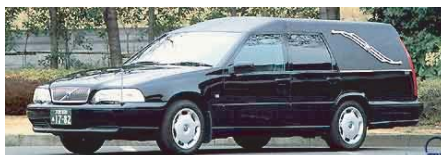
出棺の車両変更ご希望の場合はお申し 付け下さい