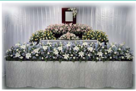
セット +189,000円にて上記 花祭壇に変更できます