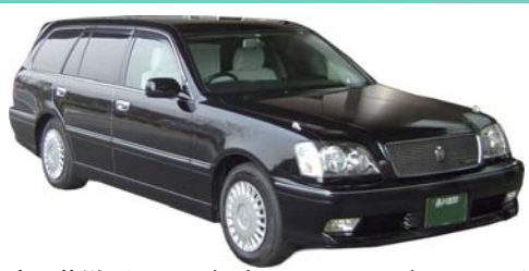
瑞江葬儀所への霊柩車とマイクロバス 24人乗り (エステイマ型になる場合がございます。ご了承下さい)