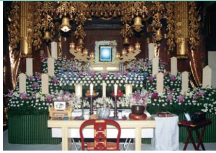
セット +94,500円にて上記 花祭壇に変更できます