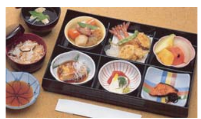
セット +23,100円にて セット鈴蘭@20より上記 写真あけびに変更できます