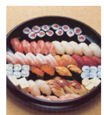
セット +20,160円にて 巻寿司を上握寿司 8台へ変更できます