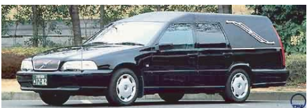
出棺の車両変更ご希望の場合はお申し 付け下さい