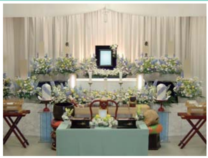
セット +73,500円にて上記 花祭壇に変更できます