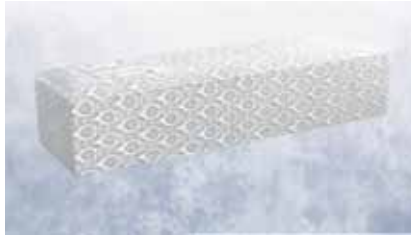
白布張り高級棺 (6尺) (6.25尺へ変更は +3,150円)

菩提寺が無い又は遠方で来られない等の場合は担当者へお申し付け下さいご紹介いたします。(1日5万円よりご紹介できます。)