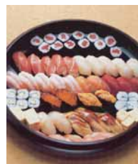
セット+21,168円 にて巻寿司を上握 寿司変更できます