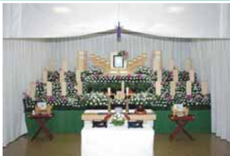
セット+9万円にて上記 花祭壇に変更できます 写真祭壇脇ご供花は一对 (2基) セットに含みます