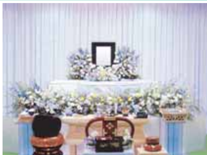
セット+7万円にて上記 花祭壇に変更できます ご供花2基はセット含みます