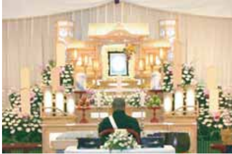
白木五段祭壇 祭壇脇生花2基を含む