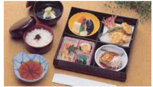
精進落とし会席ご膳【鈴蘭】@20