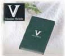
返礼品 (祖供養品) ハンドタオル@30 付き