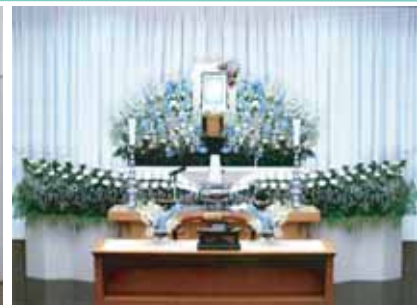
セット+18万円にて上記 花祭壇に変更できます ご供花2基はセット含みます