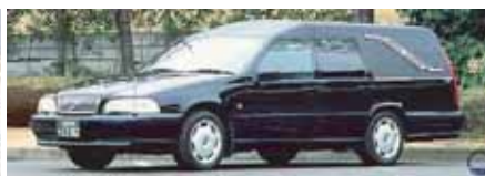
出棺の車両をご希望の場合は お申し付け下さい