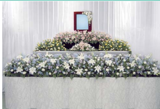
花祭壇は花材や色などご自由に指定出来ます