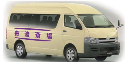
マイクロバス 斎場 ⇄ 火葬場 往復

菩提寺が無い又は遠方で来られない等の場合は担当者へお申し付け下さい ご紹介いたします。