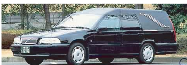
出棺の車両変更ご希望の場合はお申し付け下さい