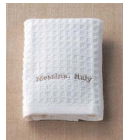
返礼品(祖供養品)ハンドタオル@60付き (525円 品種変更可、即返しの品をご用意できます。)

菩提寺が無い又は遠方で来られない等の場合は担当者へお申し付け下さい ご紹介いたします。