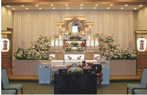
プランの白木五段祭壇例 (祭壇脇生花2基を含む)