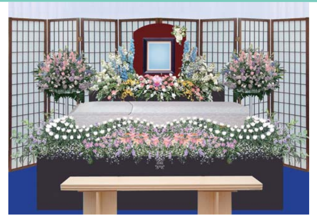
その他飾り付けの変更承ります。