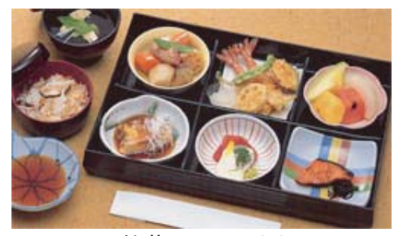
セット鈴蘭@20より上記 写真あけび等に変更できます (単価 3,570円) (差額 1,155円 × 20個)