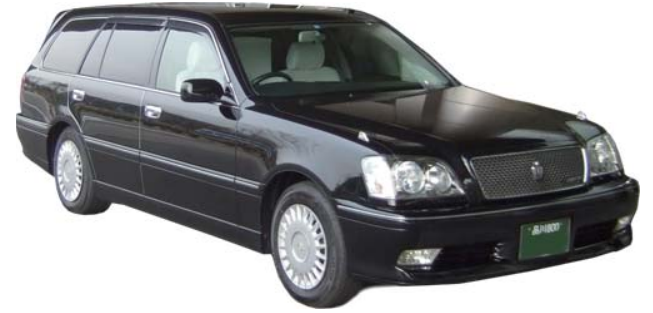
火葬場への霊柩車 (エスティマ型になる場合がございます。ご了承下さい)