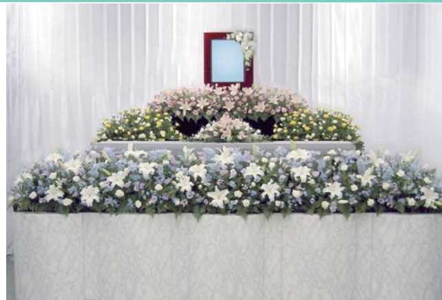
花祭壇は花材や色などご自由に指定出来ます