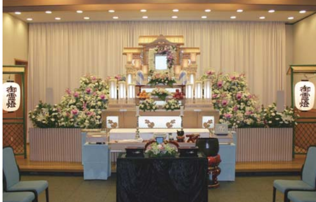
プランの白木五段祭壇例 (祭壇脇生花2基を含む)