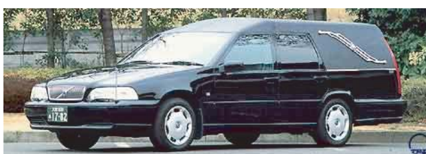
出棺の車両変更ご希望の場合はお申し付け下さい