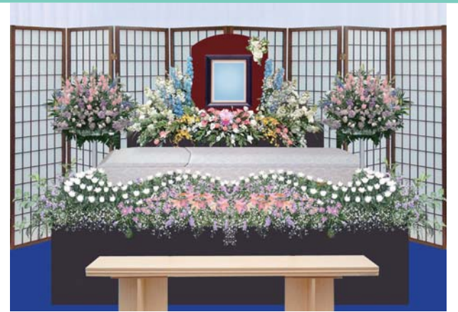
その他飾り付けの変更承ります。