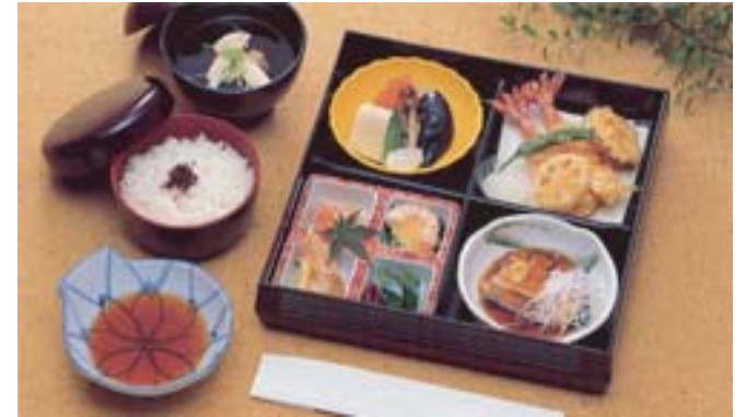
精進落とし会席ご膳 鈴蘭@10 (単価 2,415円)